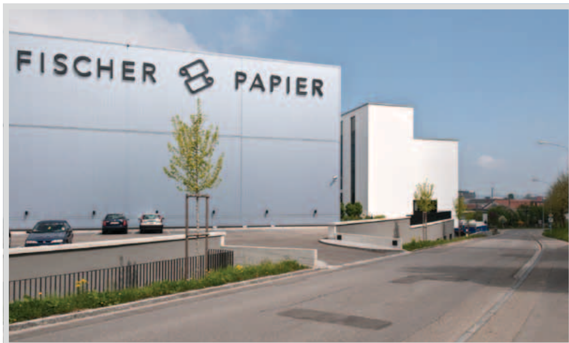
Bürogebäude und Hochregallager, St.Gallen.