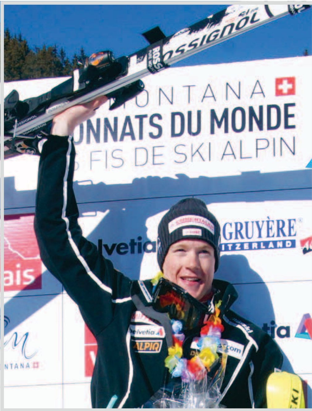
Siegerbild vom Slalom der Junioren-Weltmeisterschaften 2011 in Crans-Montana.